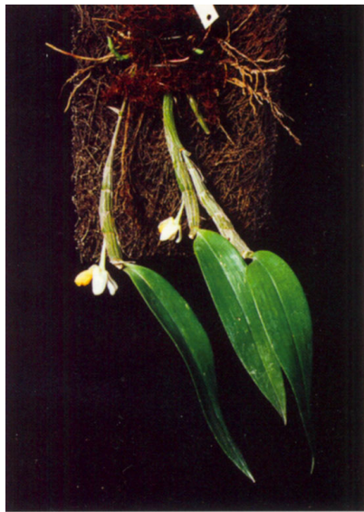
The semi-pendent growth habit of Dendrobium sibuyanense .

AMIHAN M. LUBAG ARQUIZA & ERIC CHRISTENSON